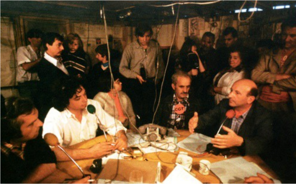
Henri Krasucki à l'antenne de LCA

Le rapport de la CGT à l'histoire de LCA est lui-même paradoxal ; nous y avons été confrontés. C'est en effet le syndicat, via son éditeur NVO, qui a permis l'existence de "Un morceau de chiffon rouge", en acceptant de l'éditer sans toucher au travail sonore – c'était le deal de départ – et en finançant l'impression des coffrets. Et c'est cette même CGT qui a ensuite multiplié les difficultés sur des questions périphériques. Qui va écrire le livret accompagnant le coffret ? Pour y dire quoi ? Qui va parler du projet, les auteurs ou les dirigeants syndicaux ? Ces complications illustrent la réalité de ce qu'a toujours été la CGT : un archipel aux multiples contradictions. »