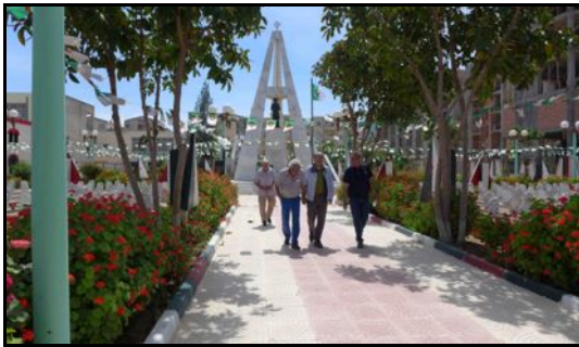
Cimetière mémorial d'Ighzer Amokrane

Cette histoire a bouleversé leurs vies. Mais – aujourd'hui – ils veulent contribuer à en écrire une autre page... Solidaire et fraternelle, celle-là.